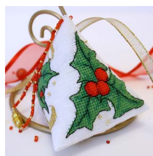
Berlingot Ruban et Houx