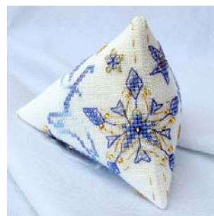
Berlingot Etoile Frosty

Ces modèles et bien d'autres encore sont disponibles sur le site Creative Poppy www.creativepoppy.fr