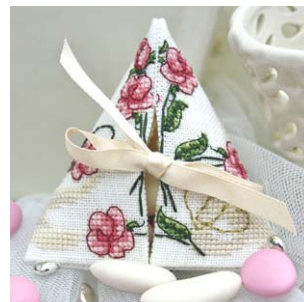
Berlingot Sweet Roses