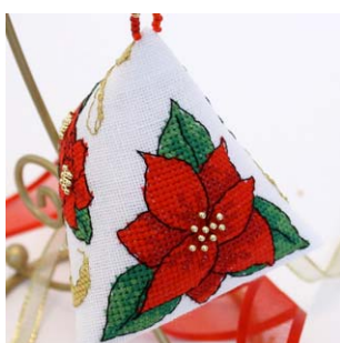
Berlingot Ruban et Pointsettia