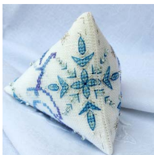
Berlingot Flocon Frosty