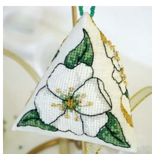
Berlingot Ruban et Rose de Noël