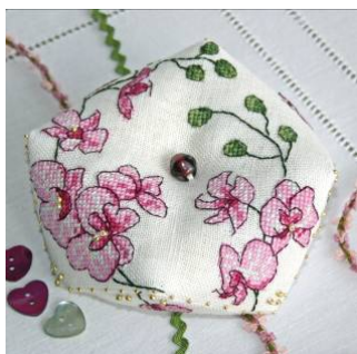
Biscornu Orchidée mauve