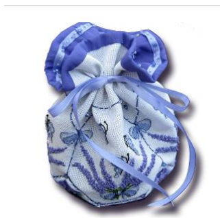
Pochon Bouquet de lavande