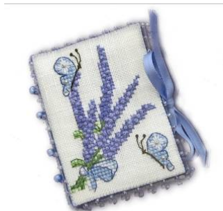
Livret à aiguilles Bouquet de lavande