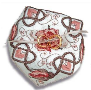
Biscornu Rose sepia