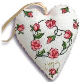
Cœur « Sweet roses »