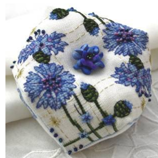
Biscornu aux bleuets