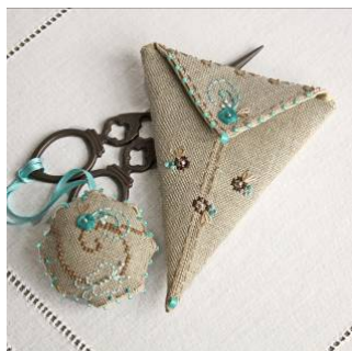
Etui ciseau Papillon