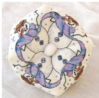
Biscornu au bonhomme de neige