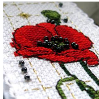
Marque-page au Coquelicot