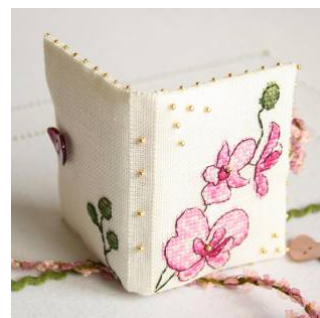
Livret à aiguilles Orchidée mauve