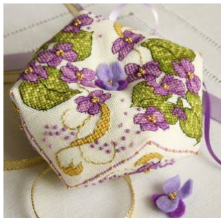
Biscornu aux violettes

Découvrez d'autres modèles créés par Faby Reilly