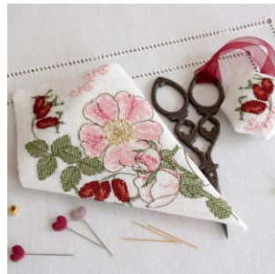
Etui à ciseaux Eglantine