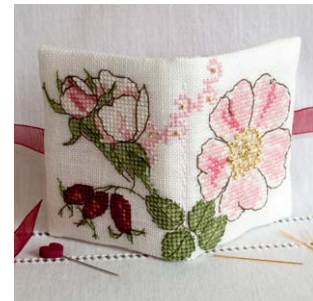
Livret à aiguilles Eglantine