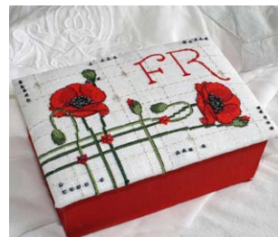
Boite coquelicot et Alphabet