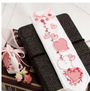
Marque-pages et sa breloque Joli Coeur