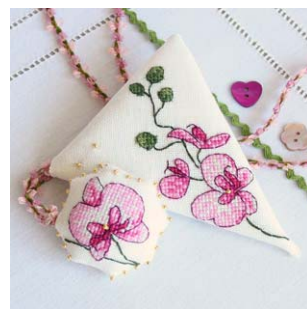
Etui à ciseaux orchidée prune