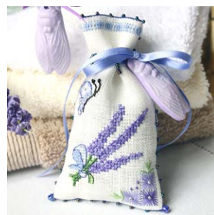
2 Sachets de lavande

Ces modèles et bien d'autres encore sont disponibles sur le site Creative Poppy www.creativepoppy.fr