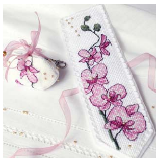
Marque-pages et breloque orchidée prune