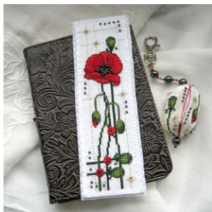
Marque-pages et porte-clés coquelicot

Découvrez d'autres modèles de marques pages et modèles assortis, créés par Faby Reilly