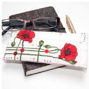
Etui à lunettes coquelicot