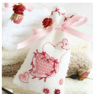
Sachet Joli Coeur et sa breloque