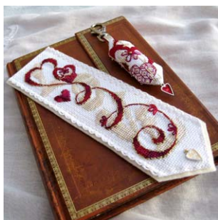
Marque-pages et porte-clés Love