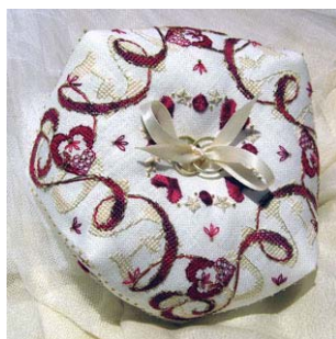
Coussin à alliances Love