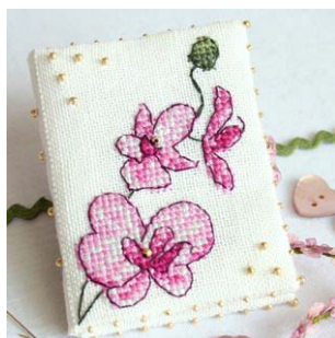
Livret à aiguilles orchidée prune