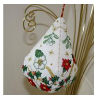
Pendeloque de Noël