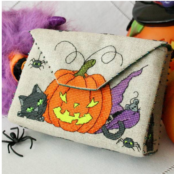
Modèle de broderie point de croix Pochette Halloween, création Faby Reilly

Cousez ensemble les points arrière qui se font face, comme montré sur la photo.