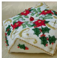
Biscornu de Noël