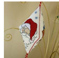
Pendouille Papa Noël

Créations Faby Reilly – Publiées par Creative Poppy