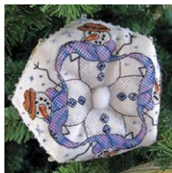
Biscornu au Bonhomme de neige

Si vous avez pris plaisir à réaliser cette pochette, vous aimerez peut-être les modèles suivants :