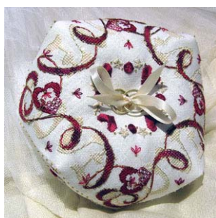
Coussin à alliances Love