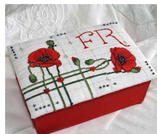
Boite coquelicot et Alphabet