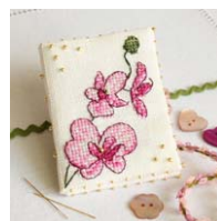
Livret à aiguilles Orchidée prune