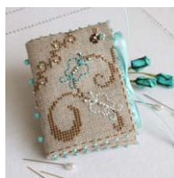
Livret à aiguilles Aux papillons