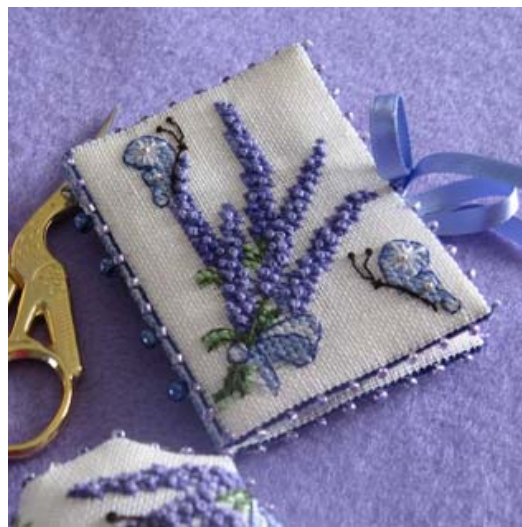
Modèle de broderie Etui à ciseaux au bouquet de lavande (point de croix), création Faby Reilly

Cousez ensemble les points arrière qui se font face, comme montré sur la photo.