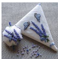
Etui à ciseaux Bouquet de lavande

Si vous avez pris plaisir à réaliser cet étui à ciseaux, vous aimerez peut-être les modèles suivants :