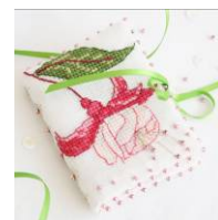
Livret à aiguilles fuschia

Créations Faby Reilly éditées par Creative Poppy