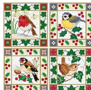
Oiseaux de Noël

Ces modèles et bien d'autres encore sont disponibles sur le site Creative Poppy