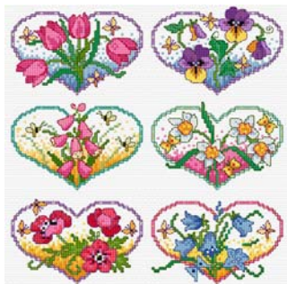
Cœurs en Fleurs