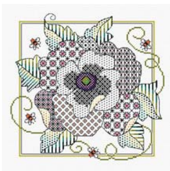
Blackwork au coquelicot