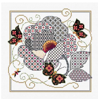
Blackwork Fleur et papillons