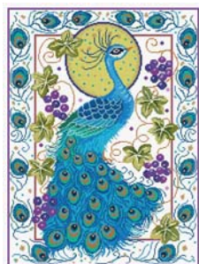
Paravent au paon

Découvrez d'autres modèles de Lesley Teare