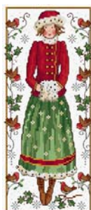
Jeune fille au houx