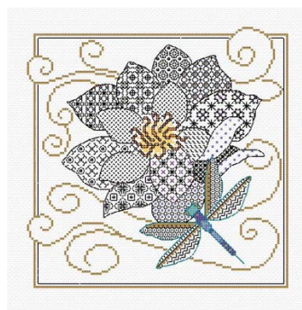
Blackwork Fleur et libellule