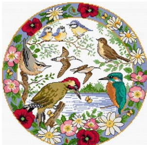
L'été des oiseaux