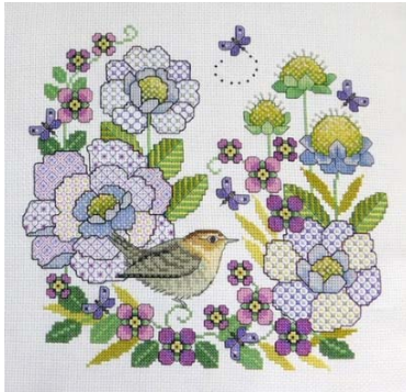
Scabieuse et passereau

Découvrez d'autres modèles de Lesley Teare