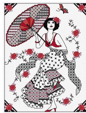
Blackwork - Dame au parasol