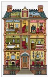
Maison de poupée viciorienne