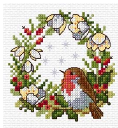
Rouge Gorge de Noël