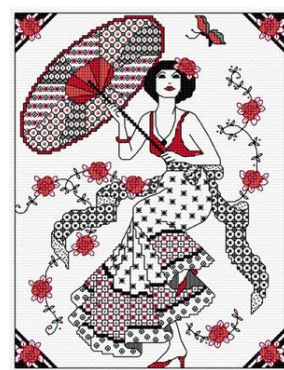
Blackwork - Dame au parasol