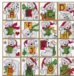
ABC ours polaire