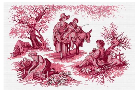
Toile de Jouy Rouge