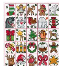
25 mini motifs de Noël

Ces modèles et bien d'autres encore sont disponibles sur le site Creative Poppy www.creativepoppy.fr