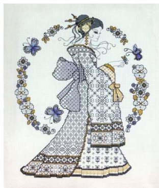
Beauté Orientale en Blackwork