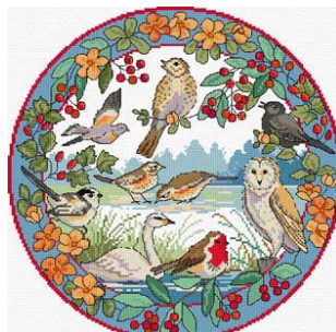
Oiseaux en hiver