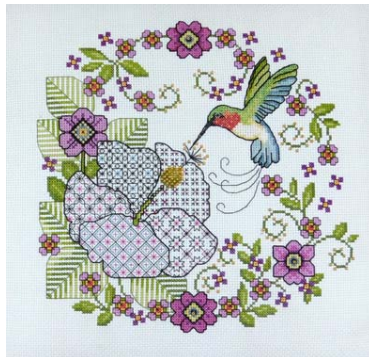
Hibiscus et Colibri