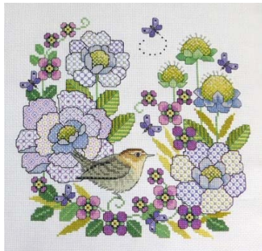
Scabieuse et passereau

Découvrez d'autres modèles de Lesley Teare