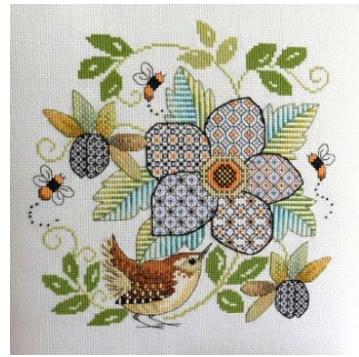
Fleur et roitelet