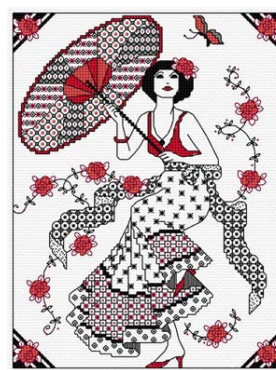
Blackwork - Dame au parasol