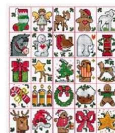
25 mini motifs de Noël

Ces modèles et bien d'autres encore sont disponibles sur le site Creative Poppy www.creativepoppy.fr