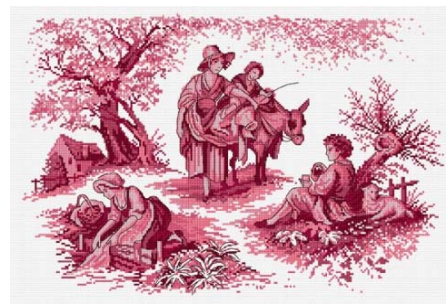
Toile de Jouy Rouge