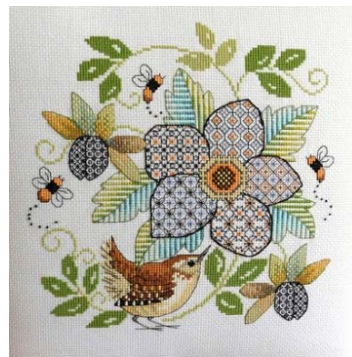
Fleur et roitelet