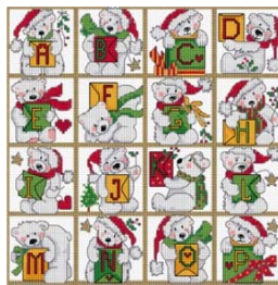
ABC ours polaire