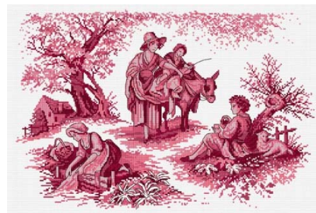
Toile de Jouy Rouge