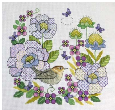
Scabieuse et passereau