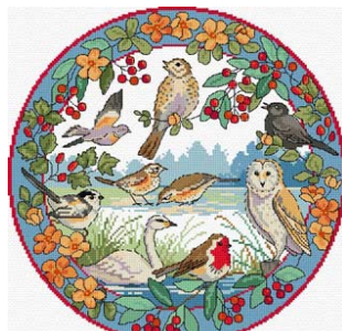
Oiseaux en hiver