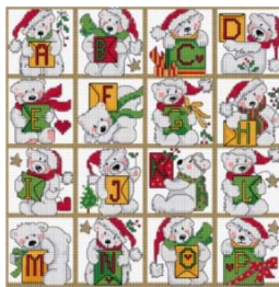
ABC ours polaire