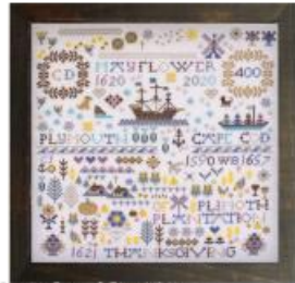
Création Poppy et Riverdrift House

Marque : Riverdrift House Référence : RDH165